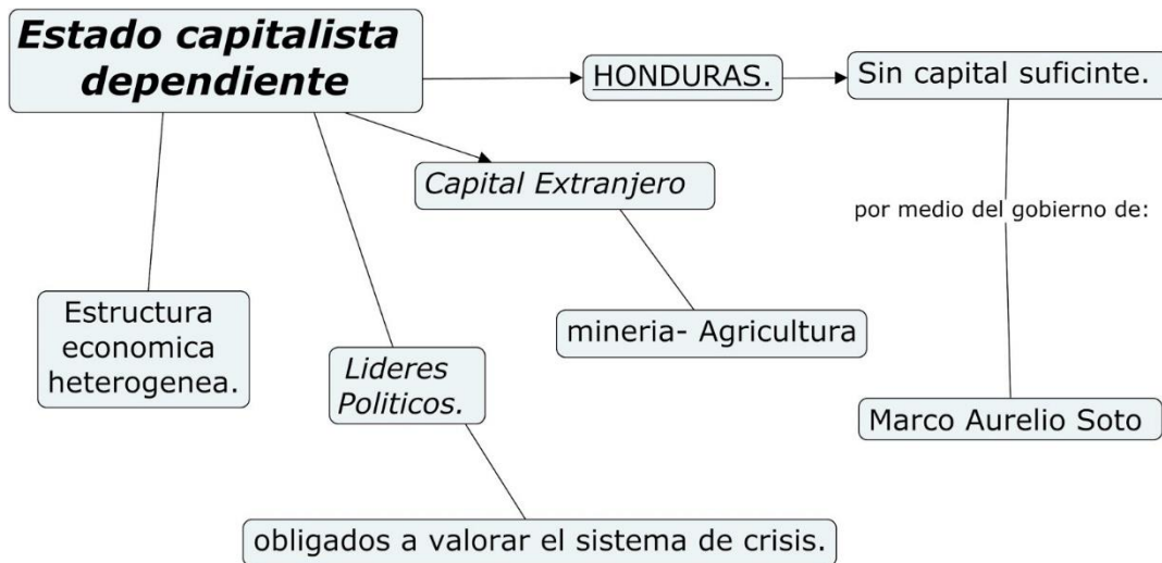
Ilustración 2-Diagrama del estado capitalista dependiente

En la ilustración 2, se muestra un diagrama del estado capitalista dependiente en nuestro país. Honduras no tenía capital suficiente para llevar a cabo sus ambiciosos programas de desarrollo económico. Las medidas que se tomaron fue crear condiciones para atraer la inversión extranjera la cual se hizo efectiva en la minería y el cultivo del banano. Su economía que hasta entonces estaba basada en la agricultura paso a ser dominada por compañías estadounidenses. El capital extranjero, la vía de plantación y la política conservadora dominaron a Honduras hasta mediados del siglo XX.